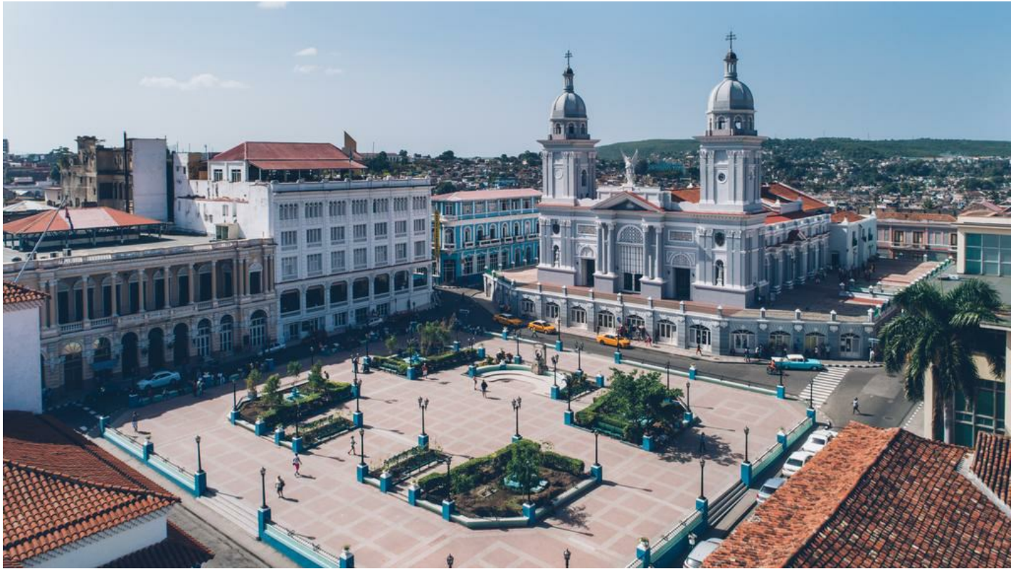
Santiago de Cuba

Dieses beliebte Hotel ist ideal, um die Atmosphäre von Santiago hautnah zu erleben.