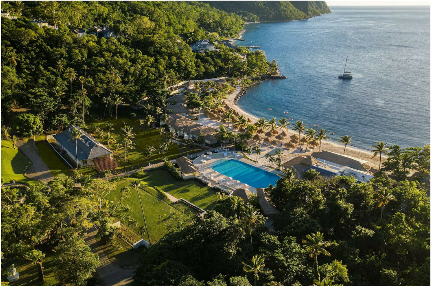
Val des Pitons

Dieses luxuriöse Resort besticht durch seine einzigartige Lage zwischen den beiden Vulkankegeln.