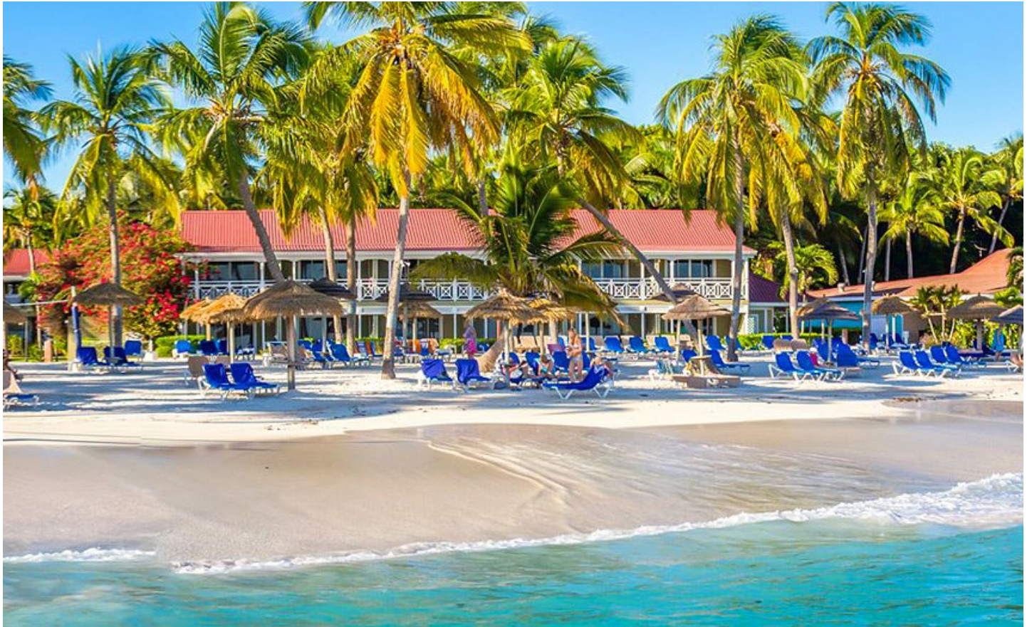
Long Bay Beach

Beliebtes All-inclusive-Hotel für aktive Strandferien, Paare wie auch Familien genießen in diesem Resort unvergessliche Ferien.