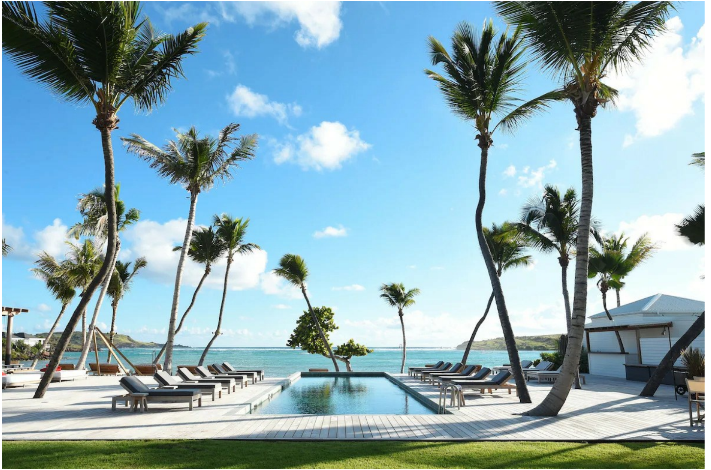
Grand Cul de Sac

Willkommen in Ihrer Oase der Ruhe und der Schönheit fernab des Alltags.