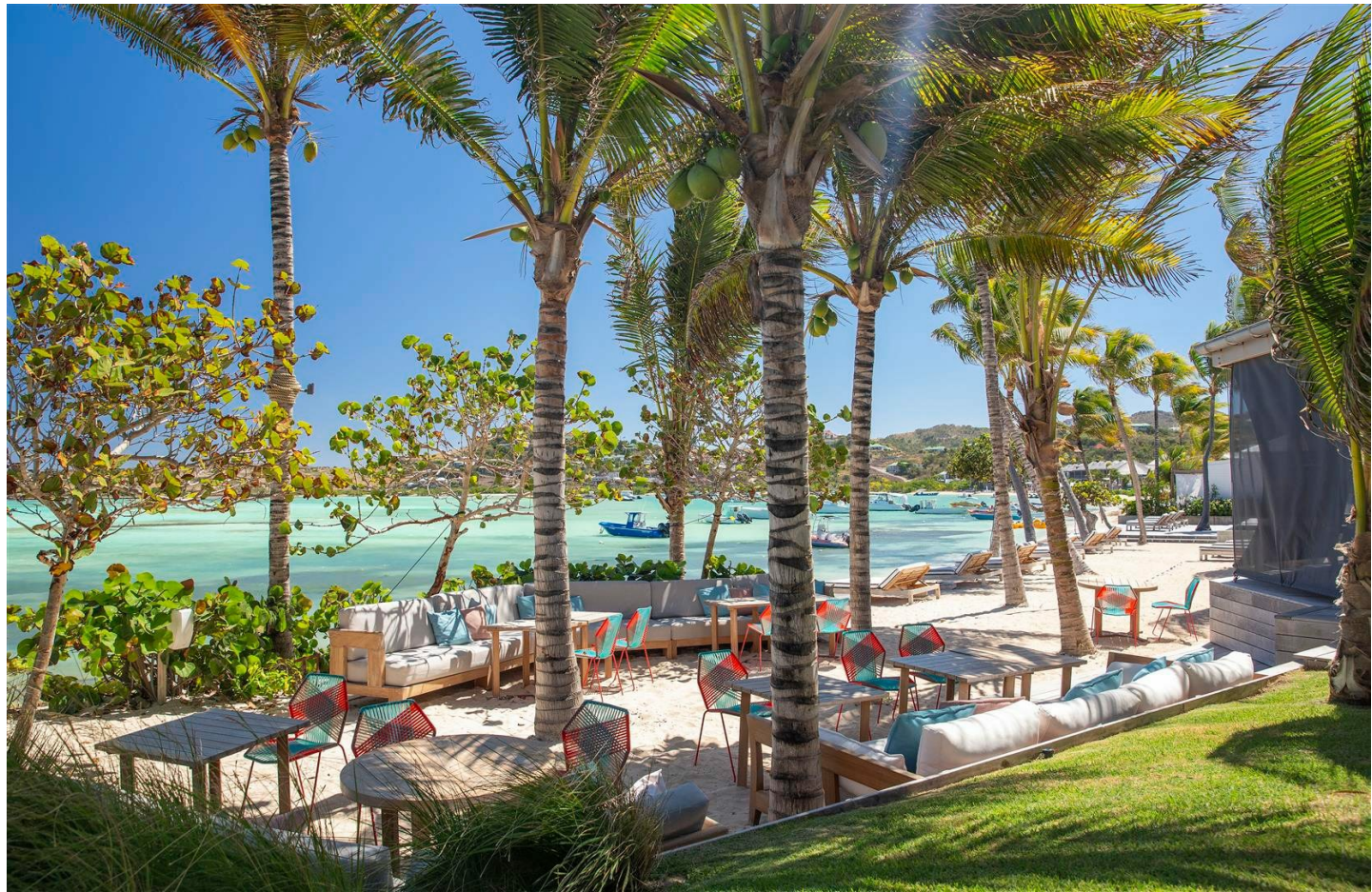
Grand Cul de Sac

Willkommen in Ihrer Oase der Ruhe und der Schönheit fernab des Alltags.