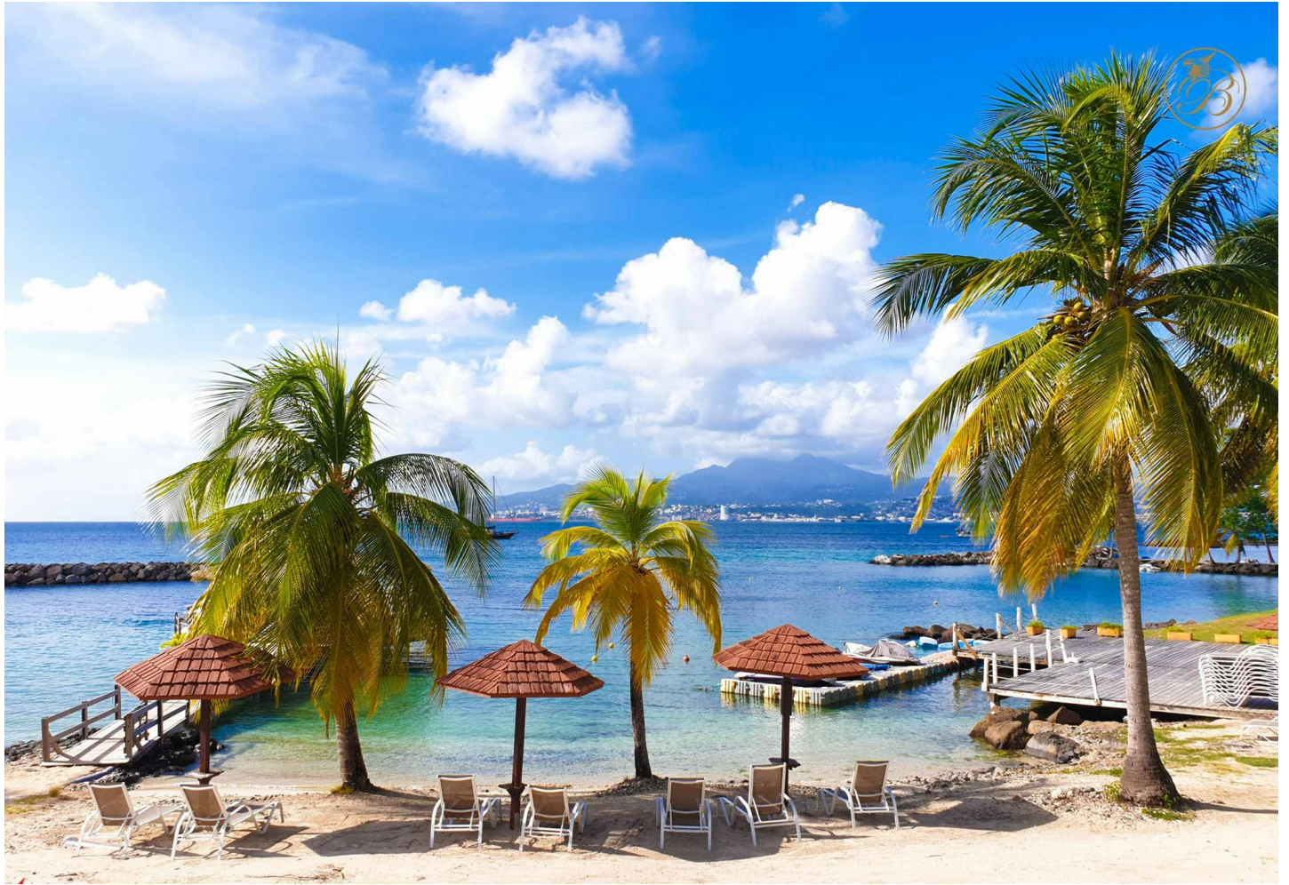
Pointe du Bout

Sehr gepflegtes Hotel mit ausgezeichneter Küche. Gourmets kommen hier auf voll ihre Rechnung.