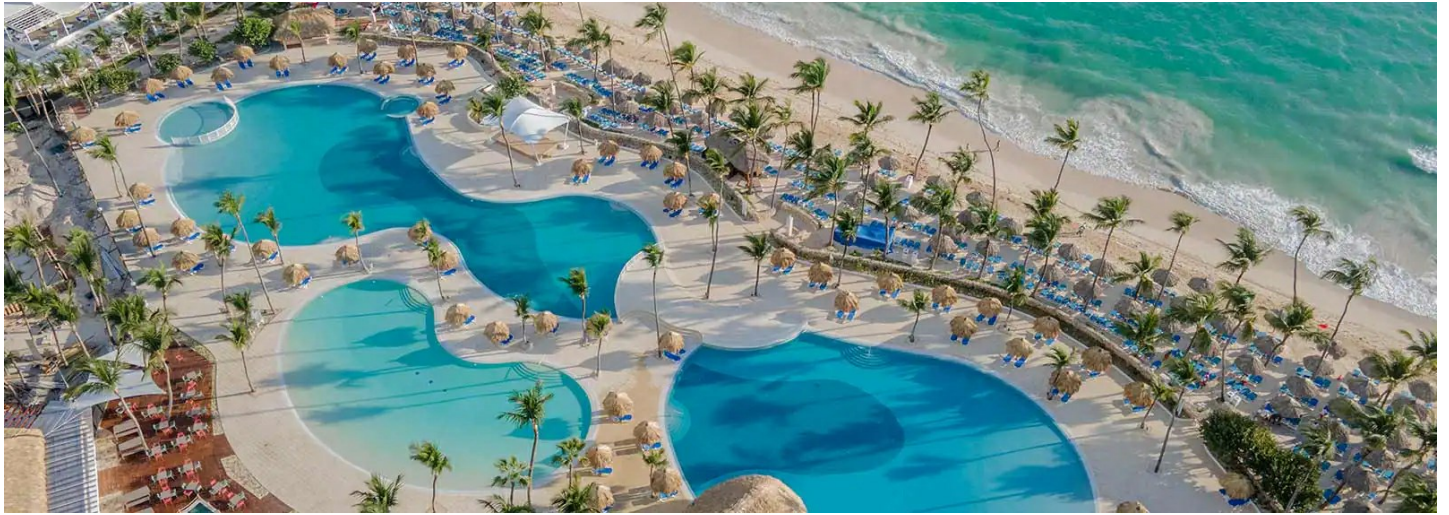
Playa Arena Gorda

Das Hotel ist äusserst beliebt und eignet sich für sportliche und erholsame Ferien in einer gepflegten, angenehmen Atmosphäre.