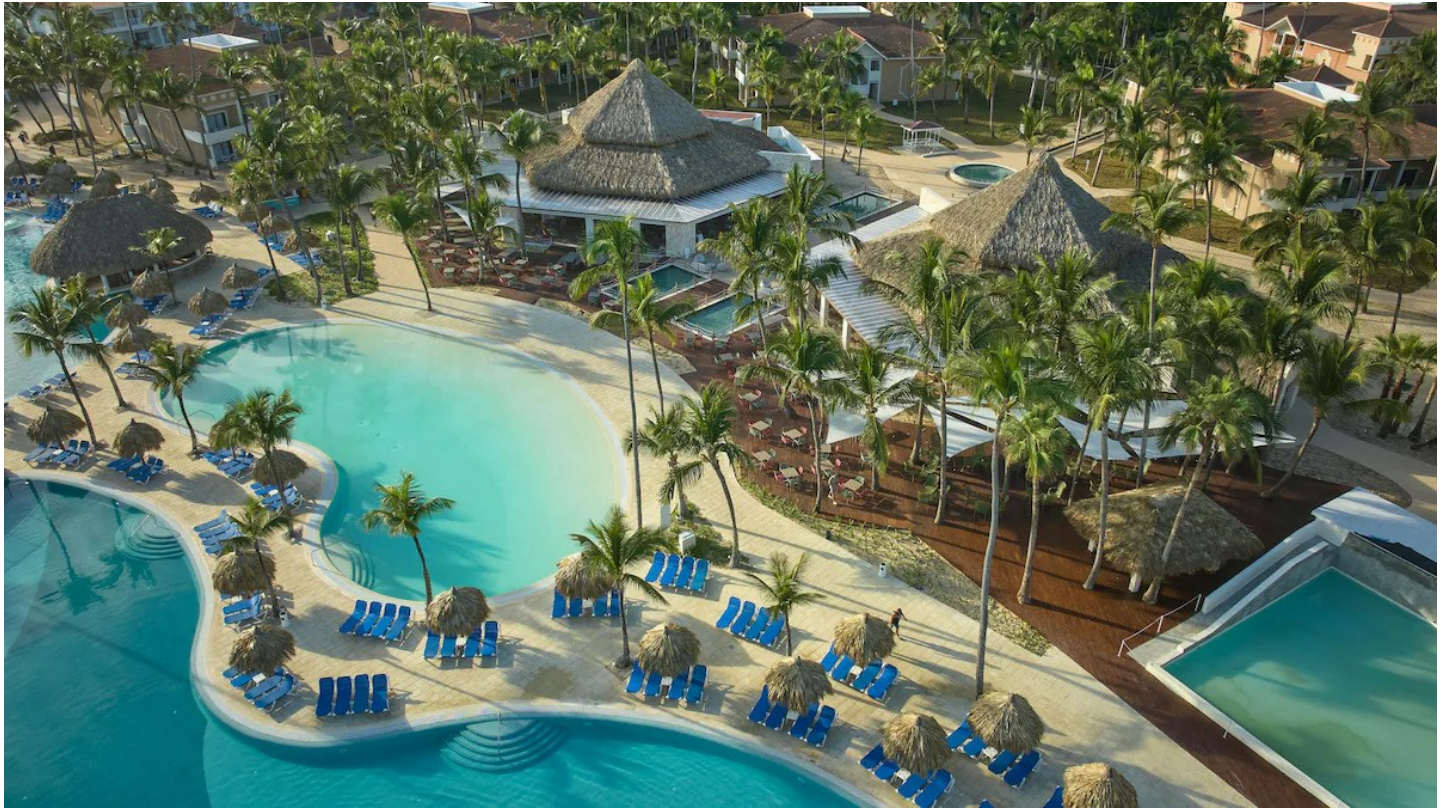
Playa Arena Gorda

Das Hotel ist äusserst beliebt und eignet sich für sportliche und erholsame Ferien in einer gepflegten, angenehmen Atmosphäre.