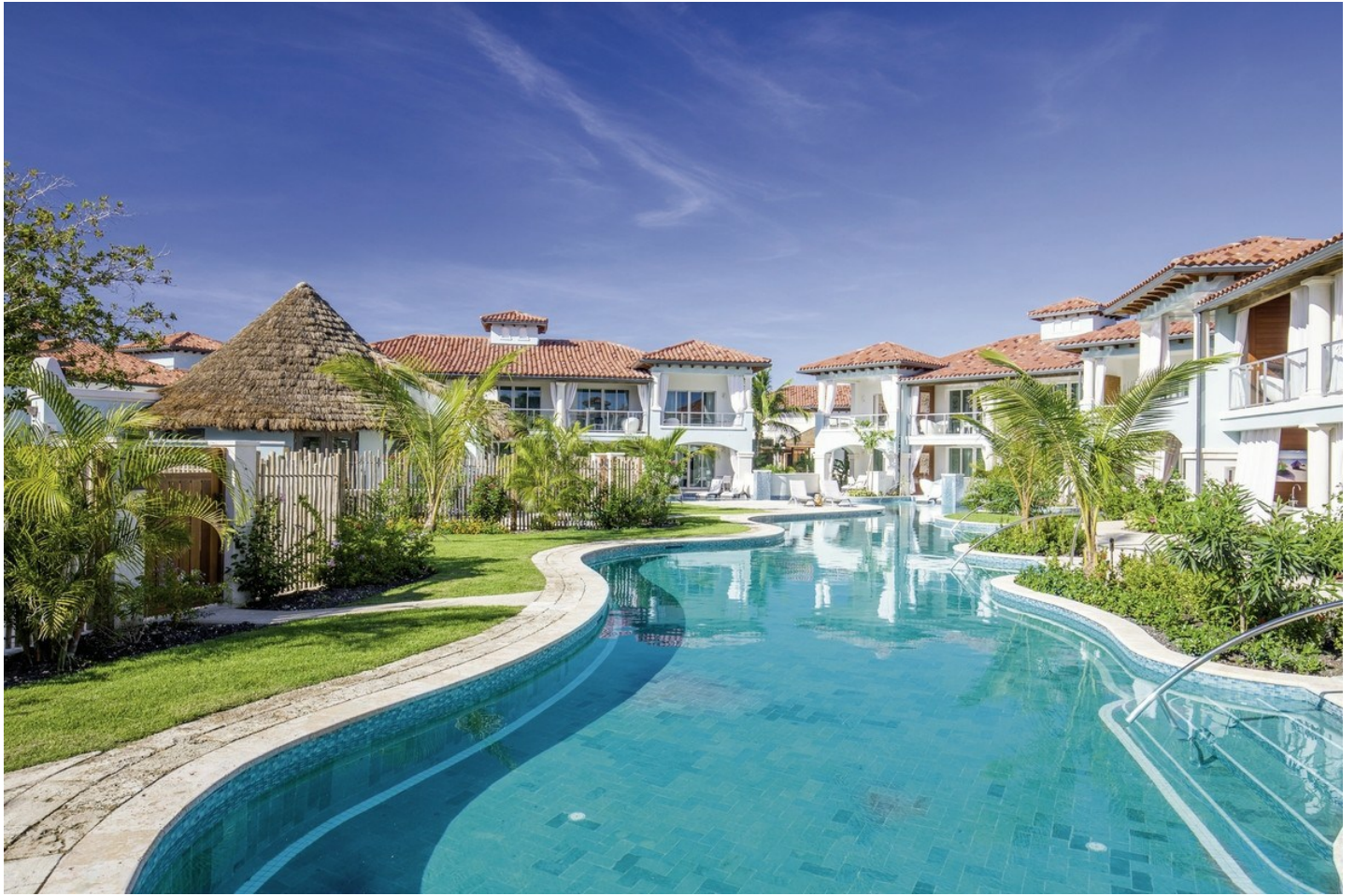
St. Lawrence Gap

Das Luxus-Hotel direkt am Sandstrand punktet mit exzellentem Service, einer schönen Pool-Oase, komfortablen Zimmern und kulinarischer Vielfalt auf Spitzenküchen-Niveau!