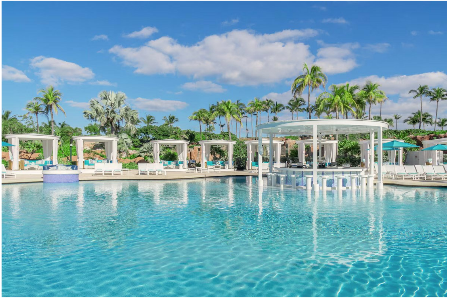
Paradise Island Beach

Die Unterkunft liegt in der Nähe der Marina und ist ideal für unkomplizierte Familien.