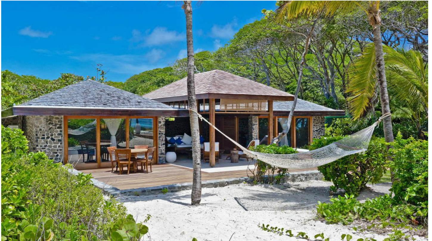
Petit St. Vincent

Entspannter karibischer Charme mit einem Hauch von Eleganz, aufmerksamer Service und viel Privatshäre erwartet Sie.