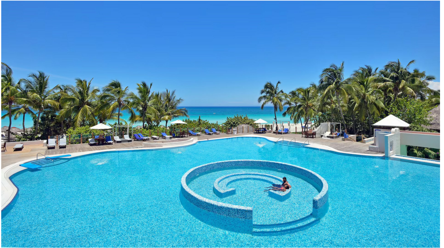
Playa de las Americas

Das an einem Traumstrand gelegene Hotel Resort ist das einzige Golfhotel mit direktem Zugang zum Varadero Golf Club.