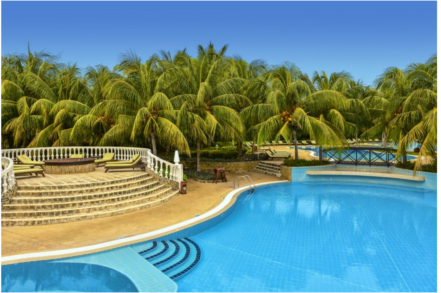
Cayo Santa Maria

Die beiden weissen Sandstrände Ensenachos und Megano sind das Highlight dieser Hotelanlage!