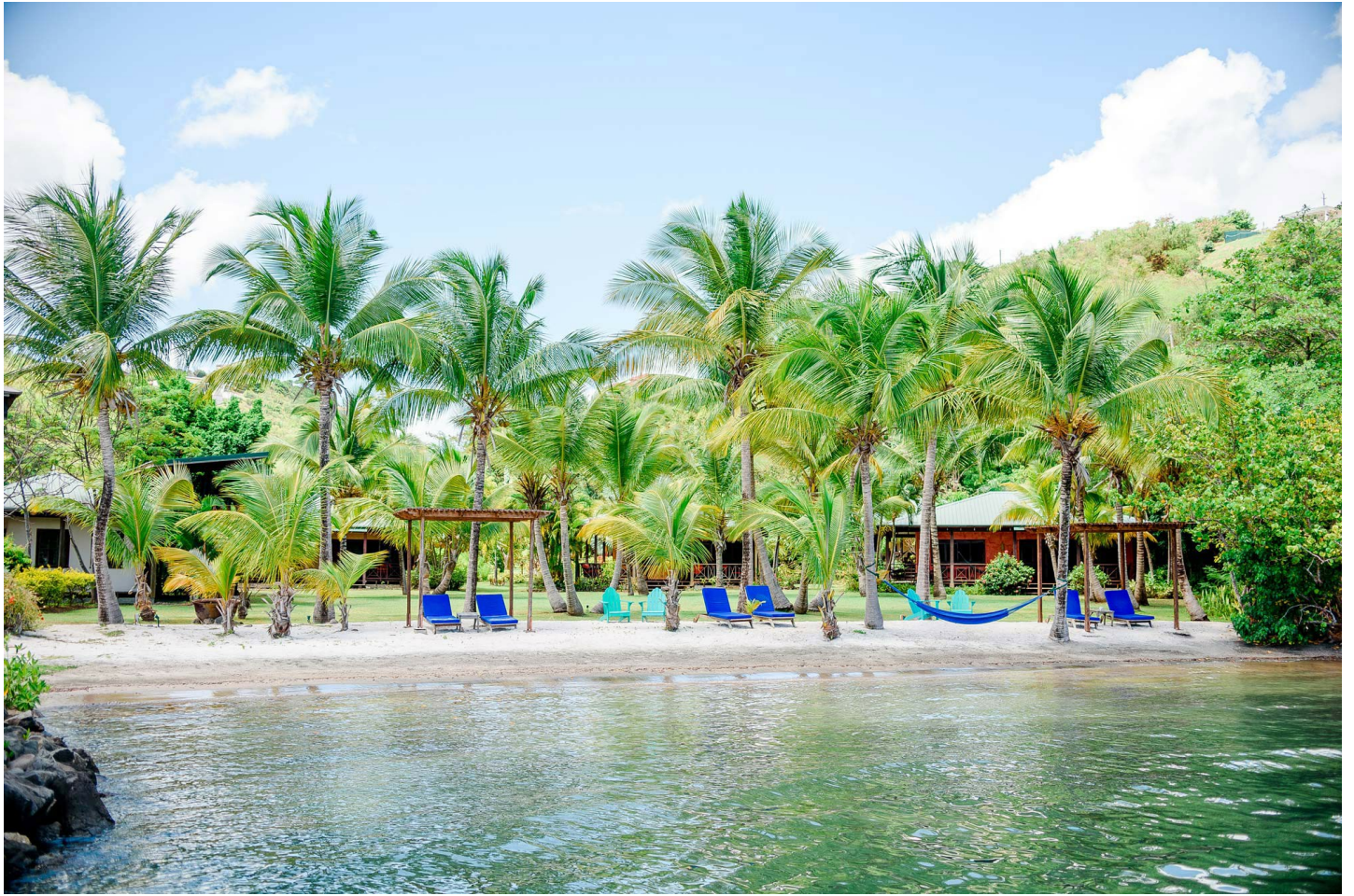
Petite Calivigny Bay

Geniessen Sie die vollkommene Entspannung in dem kleinen Resort mit ungezwungener Atmosphäre und freundlichem Service.