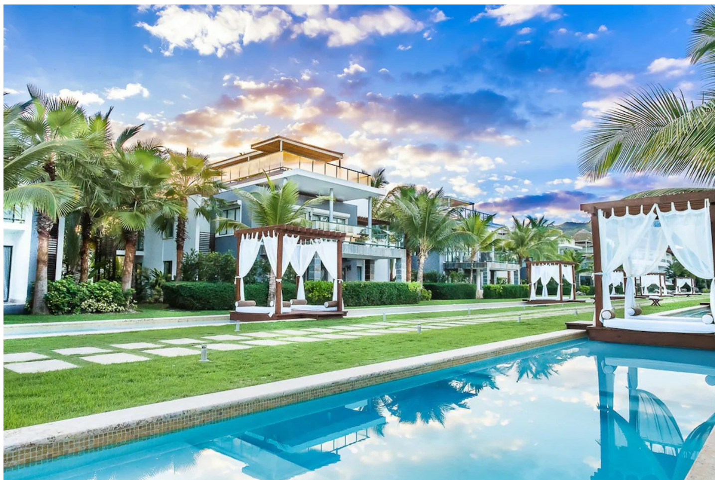
Bahia de Coson

Kleine und exklusive Suiten- und Villenanlage inmitten eines grossen, gepflegten tropischen Gartens an traumhafter Strandlage - eine Wohlfühloase für Gäste mit hohen Ansprüchen.