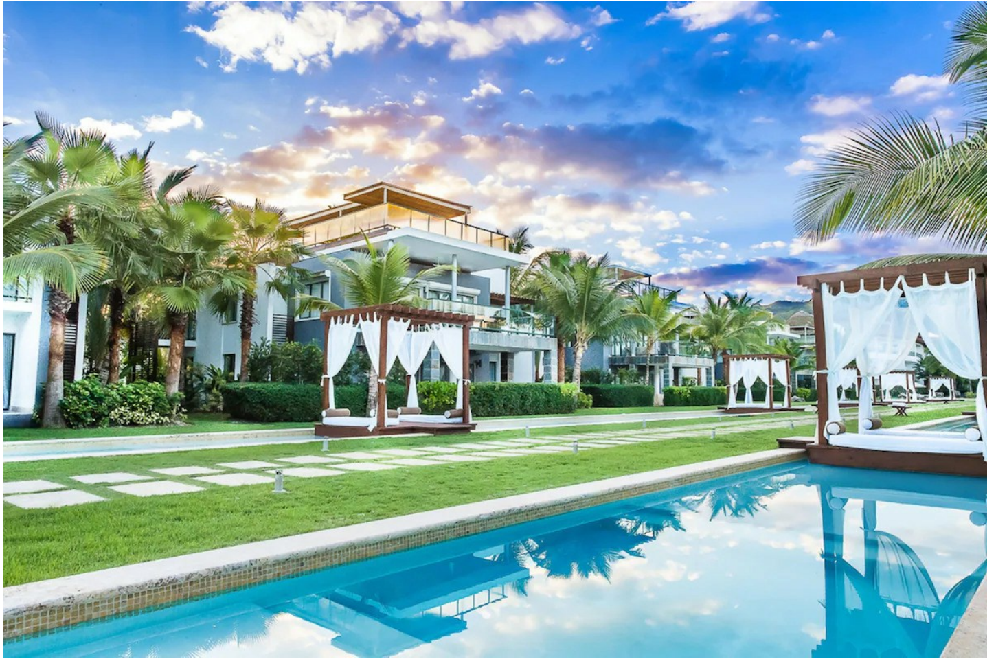
Bahia de Coson

Kleine und exklusive Suiten- und Villenanlage inmitten eines grossen, gepflegten tropischen Gartens an traumhafter Strandlage - eine Wohlfühloase für Gäste mit hohen Ansprüchen.