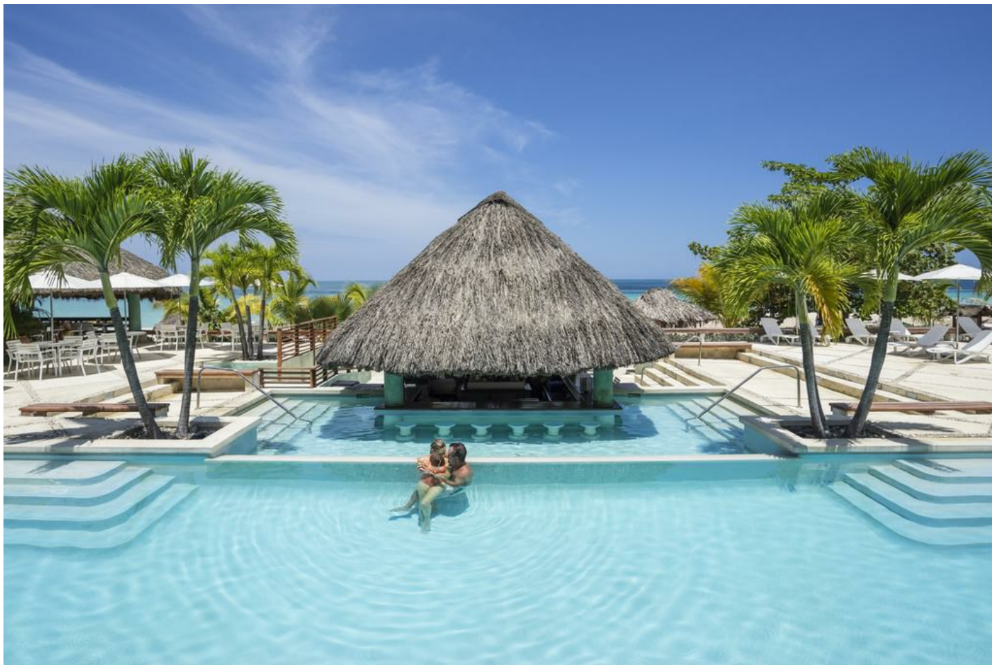
Seven Mile Beach

In lockerer Atmosphäre inmitten der tropischen Gartenanlage werden hier Ihre Karibikträume wahr!